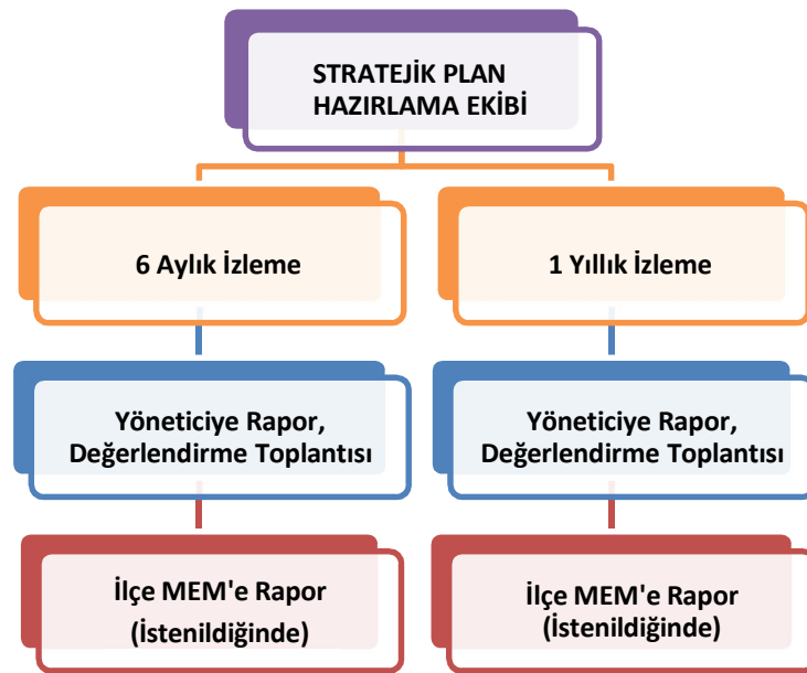
Şekil 2 İzleme ve Değerlendirme Süreci

Müdürlüğümüzün 2024-2028 Stratejik Planı İzleme ve Değerlendirme sürecini ifade eden İzleme ve Değerlendirme Modeli hazırlanmıştır. Okulumuzun Stratejik Plan İzleme- Değerlendirme çalışmaları eğitim-öğretim yılı çalışma takvimi de dikkate alınarak 6 aylık ve 1 yıllık sürelerde gerçekleştirilecektir. 6 aylık sürelerde Okul Müdürüne rapor hazırlanacak ve değerlendirme toplantısı düzenlenecektir. İzleme-değerlendirme raporu, istenildiğinde İlçe Milli Eğitim Müdürlüğüne gönderilecektir.